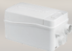
Obj. číslo: 97775318

Objem: 2,0 litre Rozmery v mm (š x h x v): 299 x 165 x 147*