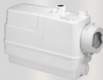
Obj. číslo: 97775316

Je kompaktná automatická prečerpávací stanica s tromi prídavnými vtokovými pripojeniami, konštruovaná špeciálne pre závesné toalety. Jej konštrukcia je kompaktná a štíhla pre jednoduchú zástavbu do steny.