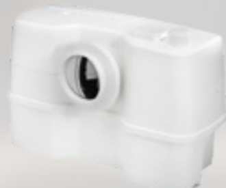
Obj. číslo: 97775314

Objem: 9,0 litrov Rozmery v mm (š x h x v): 453 x 176 x 263*