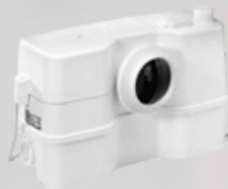
Obj. číslo: 97775315

Objem: 9,0 litrov Rozmery v mm (š x h x v): 453 x 176 x 263*