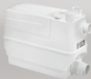
Obj. číslo: 97775317

Objem: 5,7 litrov Rozmery v mm (š x h x v): 373 x 158 x 255